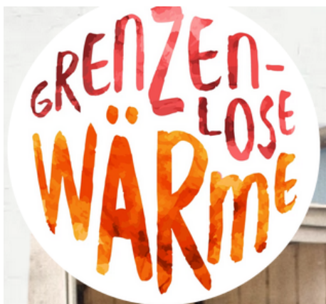
Logo Gw.png (130 KB)

Bitte ladet hier das Logo eurer Organisation hoch